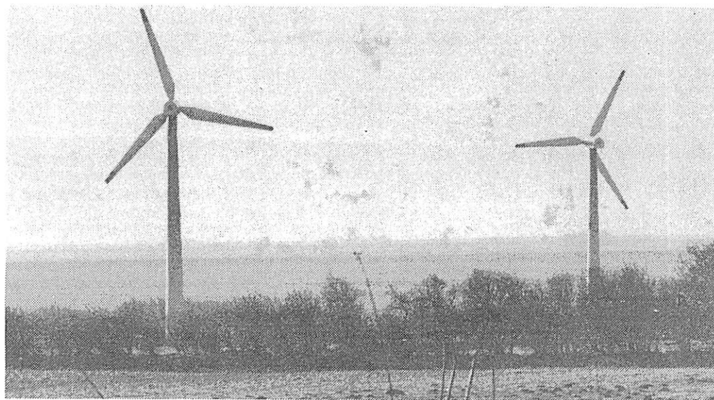
Alternativ dansk energi skal fra Flensborg markedføres syd for grænsen.