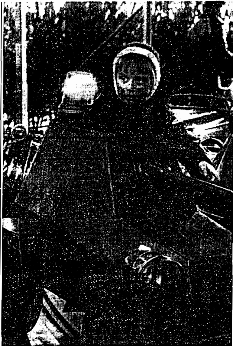
Kontraste: Ein Kindergesicht voller Unschuld schaut aus dem Turm eines Karussell-Panzers (Auf dem Weihnachtsmarkt in Ost-Berlin)

in die- imenden chschmitt sen aus ter wird itzt. Un- 0) Teil- rung der schulung cher ge- r allem eit, wur- res 2500 mter be- nach ei- e wieder